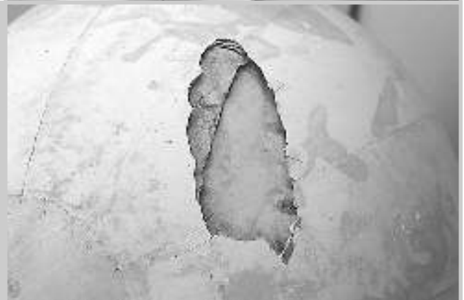
7 a und b: Arbeitsschritte zur Schließung des Lochs.