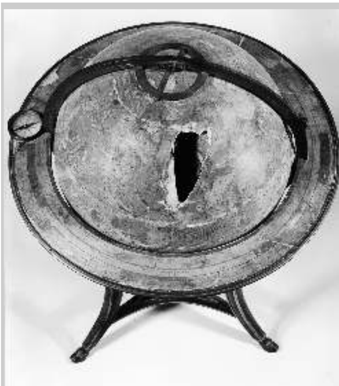
1 Eingangsaufnahme des Himmelsglobus (Foto: Reiniger, Wien).

besserte Edition des Himmelsglobus aus dem Jahre 1790. Zu diesem Zeitpunkt war Robert de Vaugondy bereits vier Jahre tot. Charles-François Delamarche übernahm seine Werkstatt und verkaufte die bekannten 18-Zoll-Globen weiterhin unter dem Namen Vaugondy.