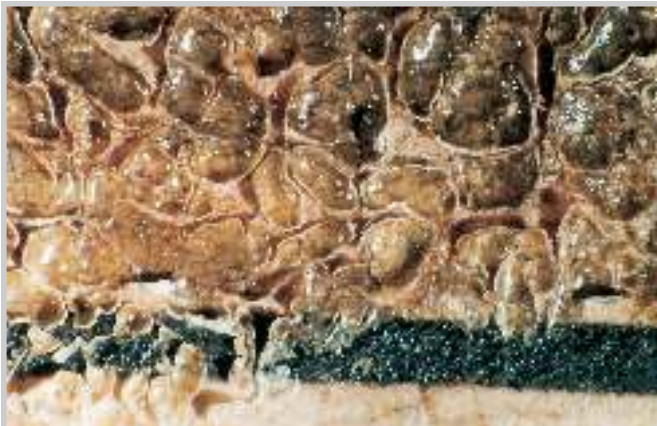
6 Nach einem kurzen Wasserbad löste sich der Firnis in Form von Schollen vom Papier. Die Tiefdruckfarbe blieb unverletzt.

Nach dem Abnehmen des Firnisses über den kolorierten Stellen konnten alle Papiersegmente abgenommen werden. Die Papiersegmente wurden auf einem Hollytex-Träger in ein Wasserbecken gelegt. Damit die abgesprengten Firnisteile seitlich zu Boden sinken konnten und das Wasser im Arbeitsbereich seine Klarheit behielt, wurde das jeweilige Papiersegment wenige Millimeter unter der Wasseroberfläche auf einer Glasplatte positioniert, die auf kleinen Stützen ruhte. Ein helles Spotlicht beleuchtete den Arbeitsbereich. Nach einigen Minuten konnte der Firnis mit einem kleinen Pinsel entfernt werden. Danach wurden die Papierteile, unterstützt durch das Hollytex-Vlies, aus dem Wasser gehoben und auf einem Löschkarton getrocknet. Kleine Firnisschollen, die beim Wässern nicht entfernt werden konnten, wurden unter dem Arbeitsmikroskop mit dem Skalpell abgenommen. Die