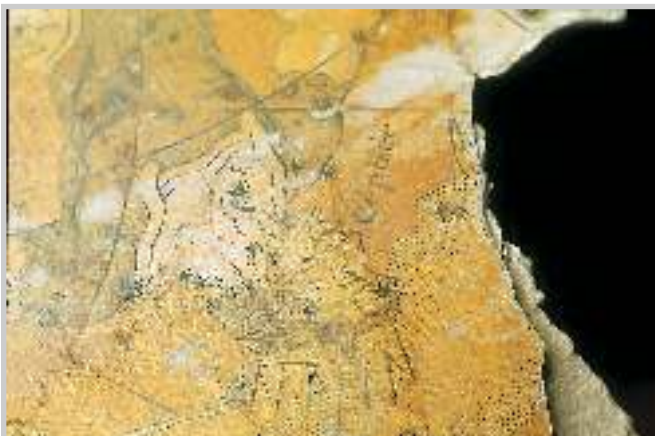
4 Detailaufnahme: Loch im Himmelsglobus (Sternbild des „Céphée“).

Es hat viele Vorteile, den Firnis im Wasserbad zusammen mit der Leimisolierung abzunehmen, denn auf diese Weise wird der Firnis nicht in Lösung gebracht und kann daher nicht in das Faservlies eindringen. Staub und Schmutzreste