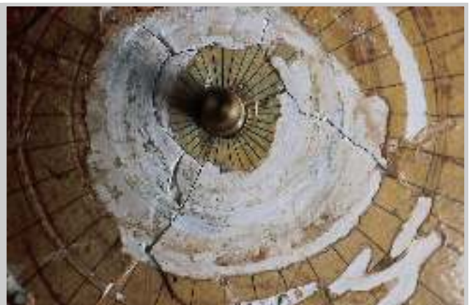
5 Zustandsaufnahme: Südpolkappe des Erdglobus.