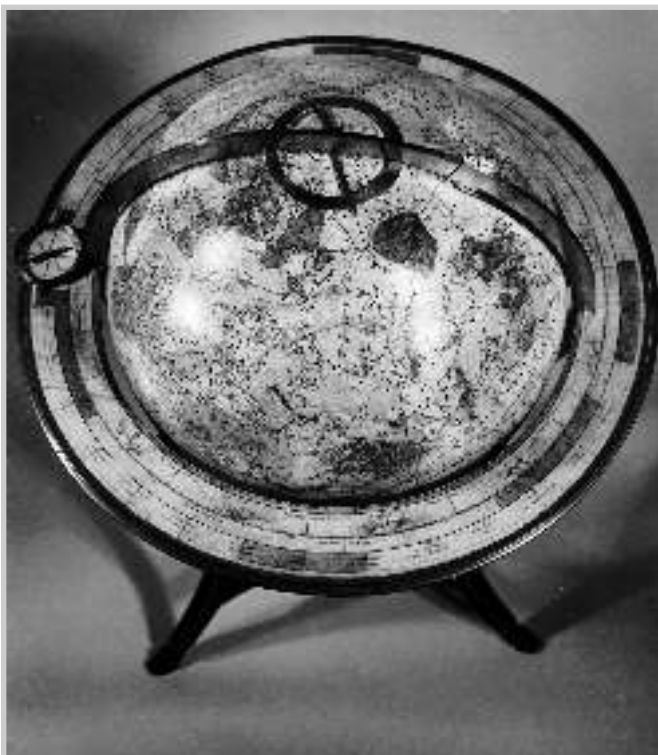
8 Schlußaufnahme des Himmelsglobus.

Die Globuskugel wurde zuletzt mit dem Meridianring wieder im Holzgestell befestigt, der Kompaß und der Beschlag des Horizontalrings mit Messingnägeln montiert (Abb. 8).