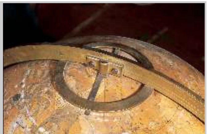
3 Zustandsaufnahme: Nordpol des Himmelsglobus.