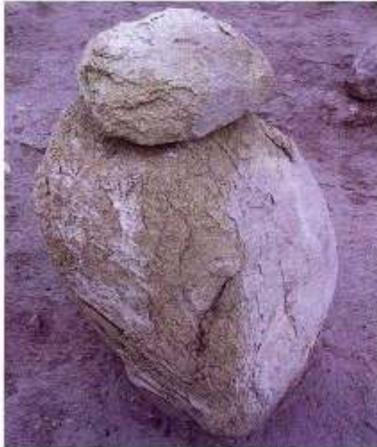
Figure 2: Severely deteriorated stone requiring external support prior to lifting. Kaman-Kalehöyük, Turkey. Resim 2: İleri derecede bozulmaya uğramış ve kaldırma öncesinde dış destek kullanılmasını gerektiren taş eser. Kaman-Kalehöyük, Türkiye.

Carefully examine stone artifacts in situ prior to lifting. Remove stable artifacts from the ground by clearing the surrounding