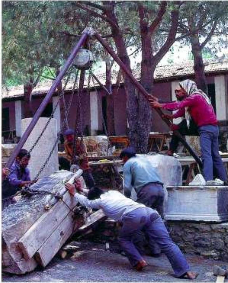
Figure 3: Lifting large stone stelae with chain hoist, Sardis, Turkey.

Resim 3: Büyük taş stelenin zincirli kaldırma yardımıyla taşınması. Sardis, Türkiye.