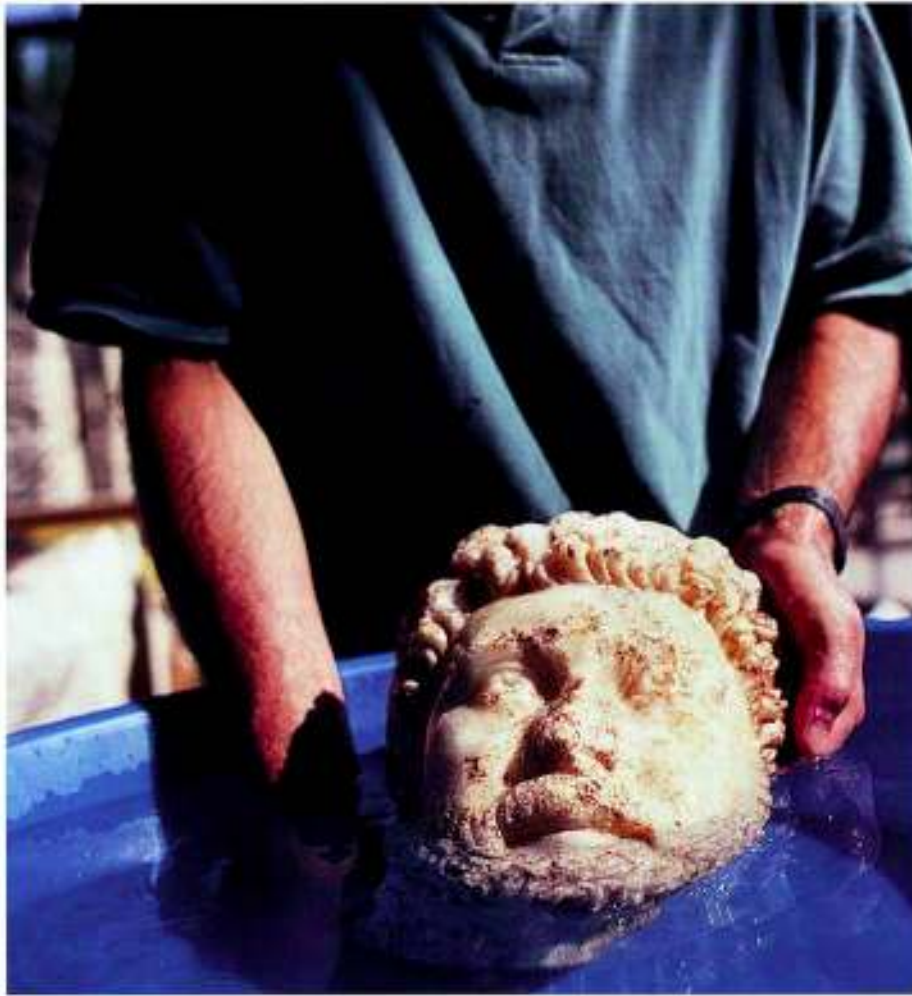
Figure 1: Washing stone head of Oikoumenios to remove loose soil deposits from burial. Aphrodisias, Turkey.

Resim 1: Taştan yapılmış Oikoumenios büstünün gömü ortamından kaynaklanan toprak tabakalarının temizlenmesi amacıyla yıkanması. Aphrodisias, Türkiye.