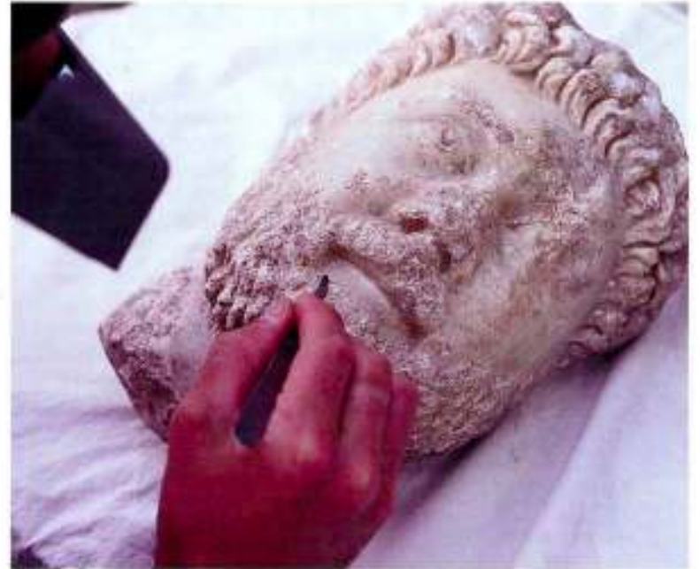
Figure 4: Careful mechanical cleaning of insoluble burial accretions from stone head of Oikomenios, Aphrodisias, Turkey. Resim 4: Taştan yapılmış Oikomenios büstü üzerindeki suda çözülmemeyen kabuk tabakasının mekanik olarak temizlenmesi.

Genel olarak, taş objeler depolanırken metal ve organik buluntular için öngörülen çevresel koşulların kontrolüne gerek duyulmaz. Buna karşın taş buluntularda tuz çiçeklenmesinin ortaya çıkmasını engellemek amacıyla kuru bir ortamda korumalarında yarar vardır. Küçük objelerin polietilen torbalar ve inert plastik kutular içinde saklanması gerekir. Polietilen köpükten yapılmış takozlar ve benzeri destekler, yuvarlak veya zemine iyi temas etmeyen objelerin stabil halde durmasını sağlamak açısından yararlıdır.